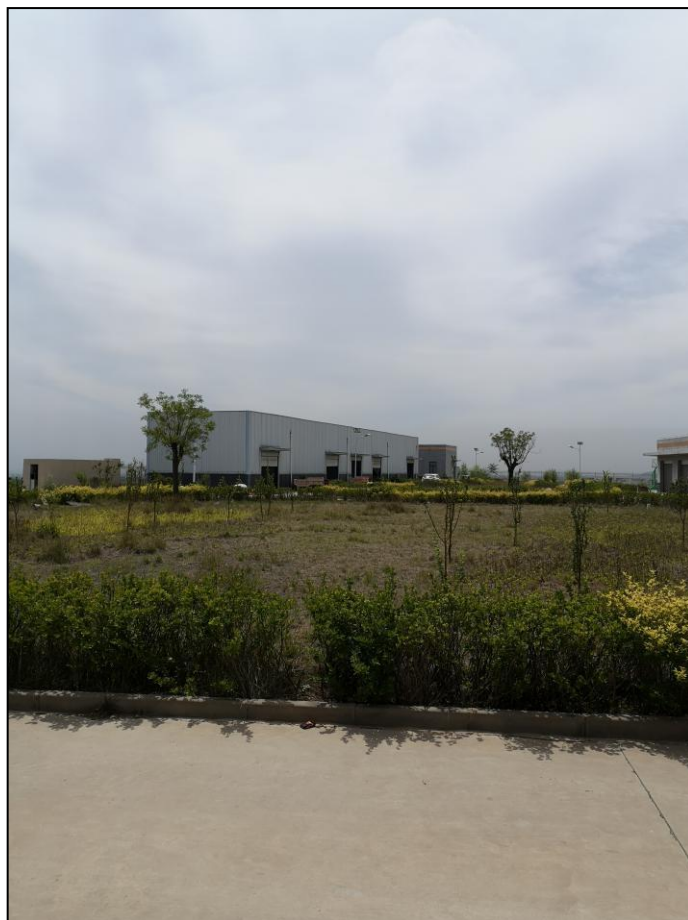
运行管理区内绿化