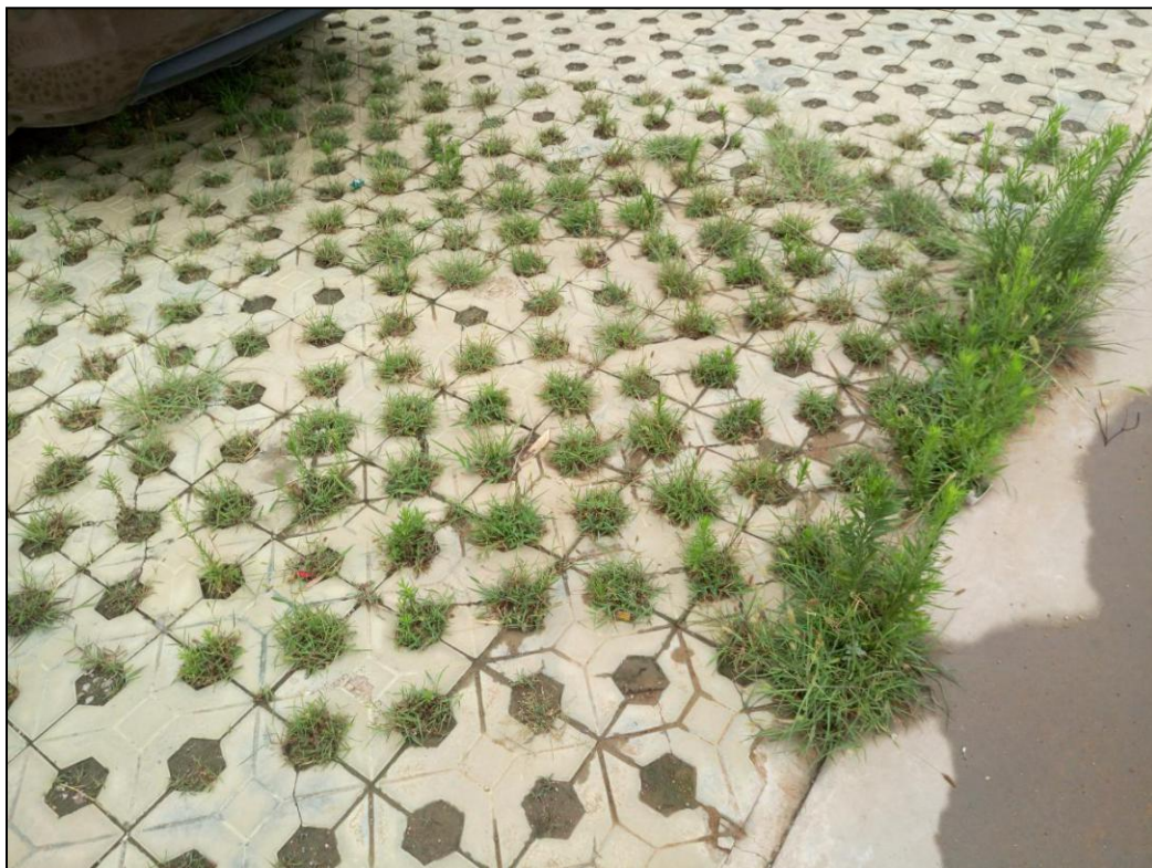
升压站内植草砖铺设