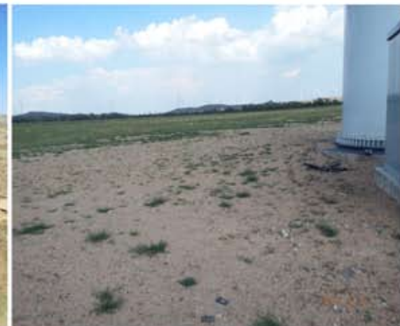
风机区植被恢复情况 2018.06