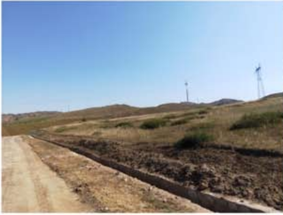
道路两侧植被恢复情况 2019.09