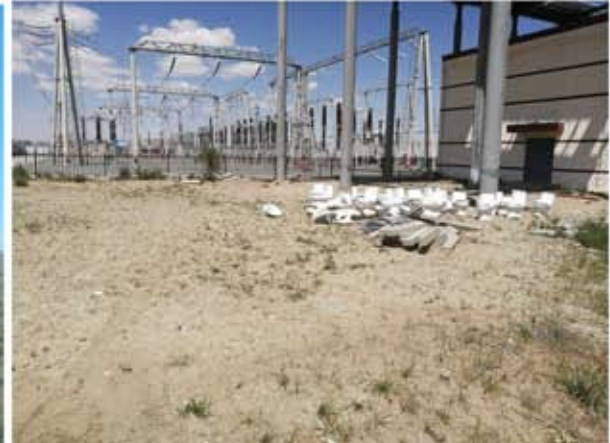
升压站植被恢复情况 2018.6