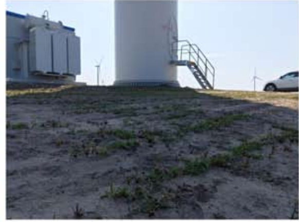
风机平台覆土种草 2019.09