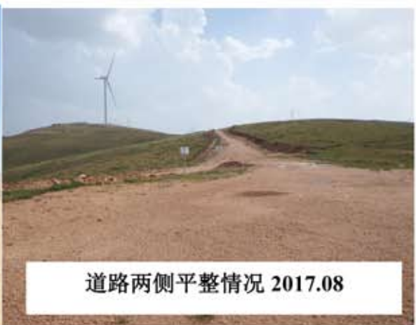
道路两侧平整情况 2017.08