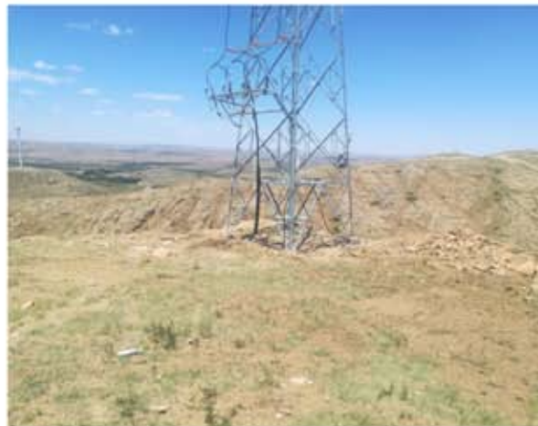
铁塔基部植被恢复情况 2018.6