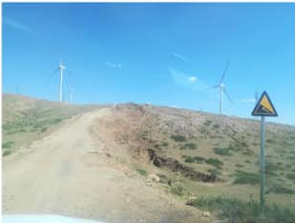
道路两侧植被恢复情况 2018.6