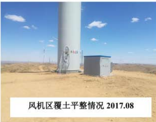
风机区覆土平整情况 2017.08