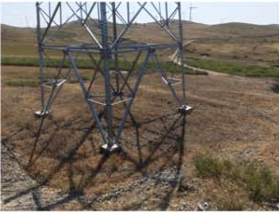
铁塔基础植被恢复情况 2019.09