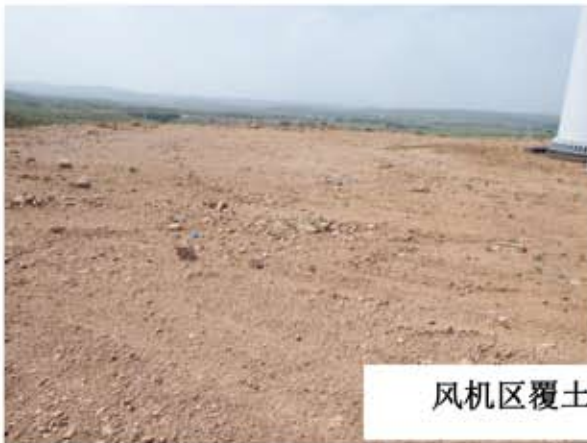
风机区覆土平整情况 2017.08