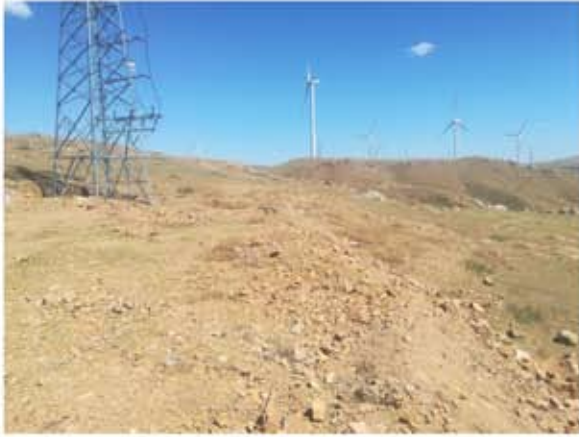
铁塔基础土地平整情况 2018.06